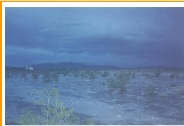
Foto 46 - 4.- Río Asunción y al fondo se observa el Templo Histórico que es siempre afectado por el río en avenidas extraordinarias

Las siguientes fotos son un ejemplo de lo que podemos observar en las áreas afectadas por este tipo de fenómenos