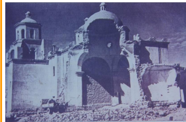
Foto 46 - 5.- Templo Histórico casi destruido en la lluvia de 1955